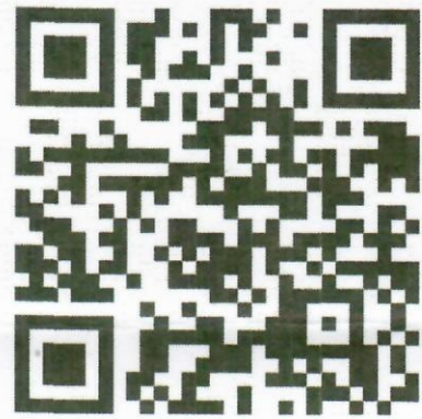
คู่มือแผนส่งเสริมสุขภาพดี (Wellness Plan)